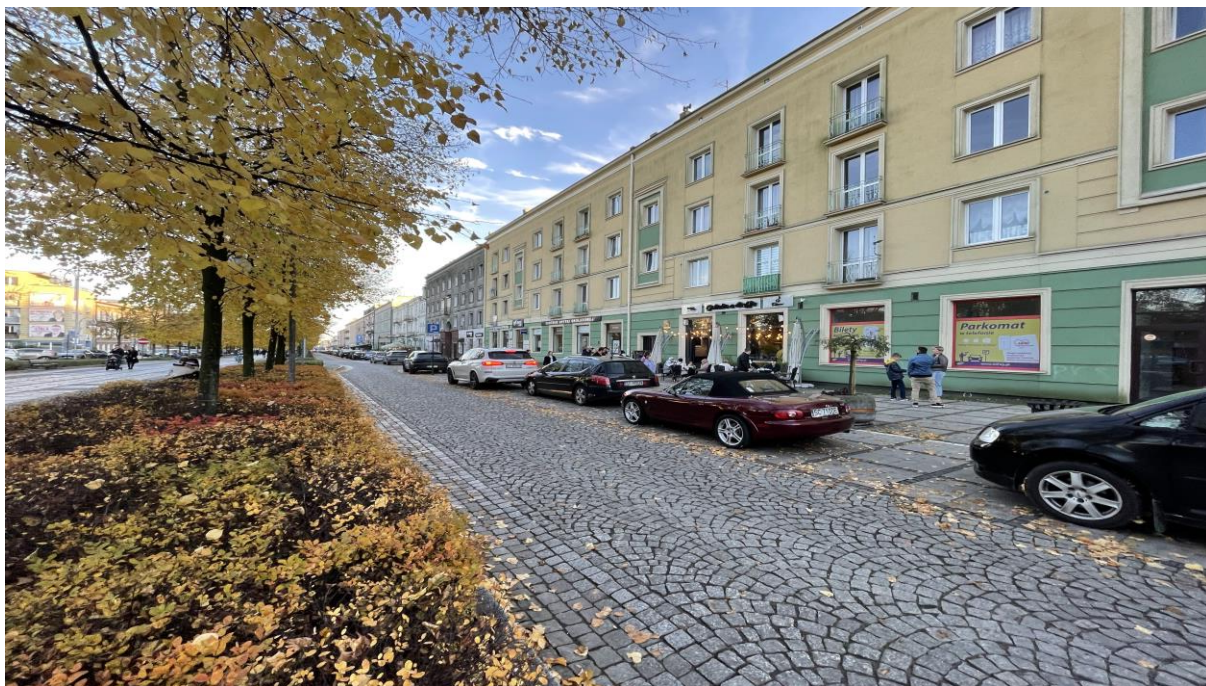
Kamienice oraz aleja drzew wzdłuż Al. Najświętszej Maryi Panny - wzdłuż głównej osi kompozycyjnej jednostki krajobrazowej