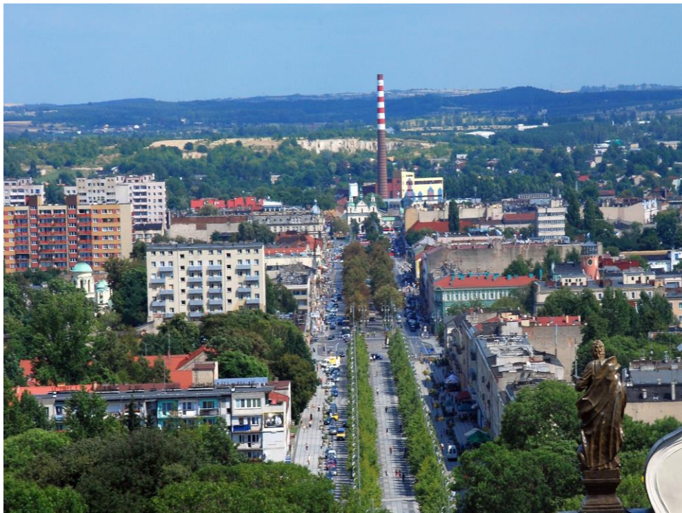
Widok ze Wzgórza Jasna Góra w kierunku wschodnim wzdłuż osi Alei Najświętszej Marii Panny; widoczna dominanta zabytkowego komina dawnej elektrowni przy ul. Mirowskiej w Częstochowie