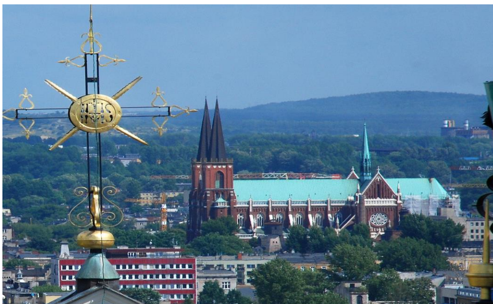
Bazylika archikatedralna Świętej Rodziny w Częstochowie - dominanta krajobrazowa