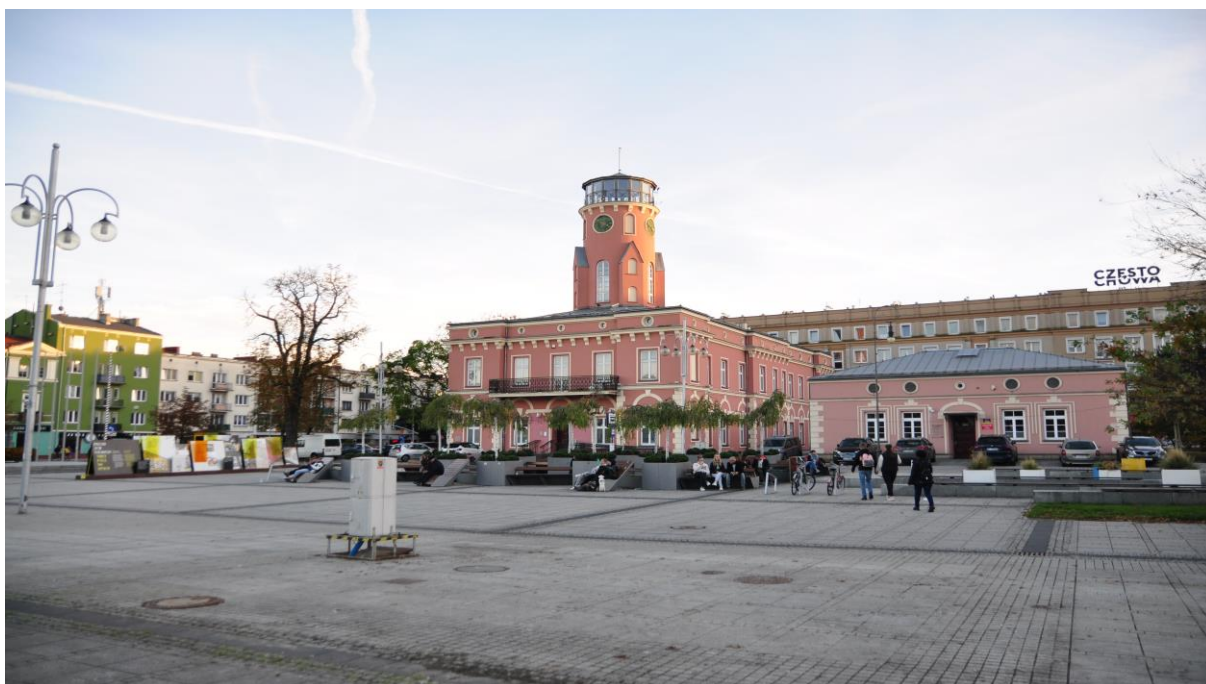
Plac Wł. Biegańskiego - wnętrze urbanistyczne z dominantą ratusza